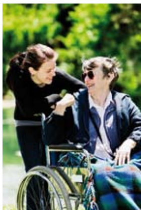
Bien-être de tous